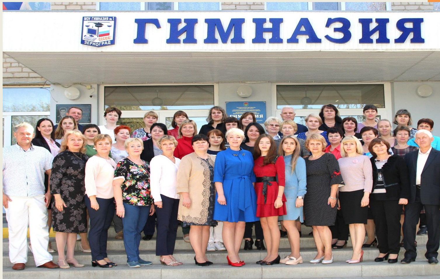
Коллектив МБОУ гимназии г.Зернограда